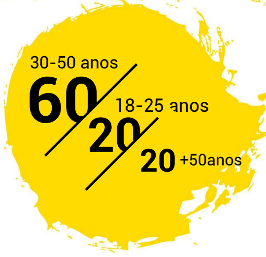
Tabela de Preços

25% DESCONTO Para empresas associadas às Instituições apoiadoras